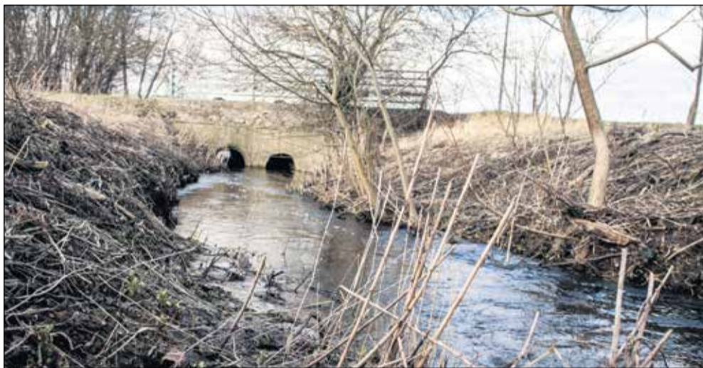
- Man skal ikke sidde med hænderne i skødet og vente på, at kommunen kommer med et nyt regulativ, lyder rådet fra formanden for Danske Vandløb.

Mange kommuner overvejer lige nu – eller er allerede gået i gang med – at tilpasse deres vandløbsregulativer til de nye vandplaner. Det betyder, at vandløbslavene og de landmænd, der har vandløb, skal op på dupperne, hvis de